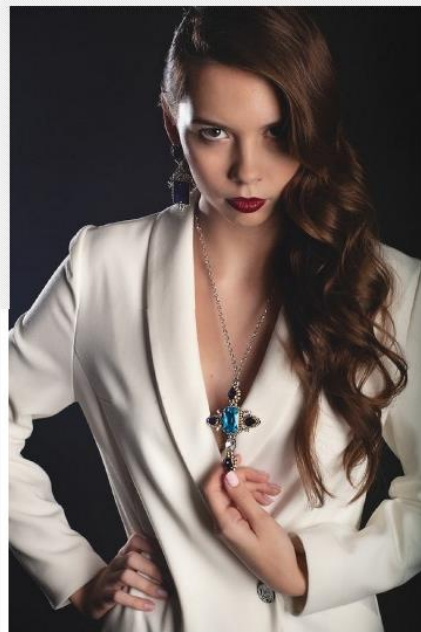
Коллекция украшений «Зима 13» by Marina Prisyach